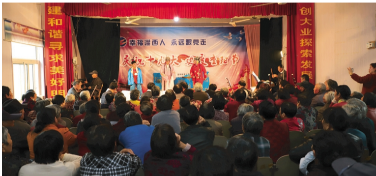
10月26日,在灌西淮海戏剧团礼堂,灌西公司举办“迎重阳”淮海戏专场演出,吸引了社区众多喜爱淮海戏的职工群众前来观看。据悉,此次迎“重阳”淮海戏演出由灌东盐场淮海戏剧团带来的,在庆祝党的十九大胜利召开的同时,加强了两场之间的交流,也将优秀传统文化很好的向职工群众进行了宣传。(封杨)