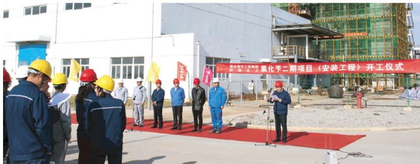
10月25日,利海化工公司举行氯化钾二期项目(安装工程)开工仪式。目前,氯化钾二期项目建设迎来了关键节点,进入了设备安装阶段。开工仪式结束后,安装单位将进驻泰乐公司,进行氯化钾二期项目设备安装做好前期准备。(郁洪兵)

集团公司2017年职工健身运动会自9月23日在徐圩新区云湖广场开幕以来,20支代表队、1000余名运动员紧扣“活力工投·聚力发展”活动主题,参加了健步走、拔河、跳绳、乒乓球、田径等5个大项20余个项目的角逐,运动员们在赛场上赛出了水平、赛出了风格,充分展示了工投人拼搏进取的精神风貌和开拓创新的时代风采,取得了运动成绩和精神文明双丰收。(工投工会 工宣)