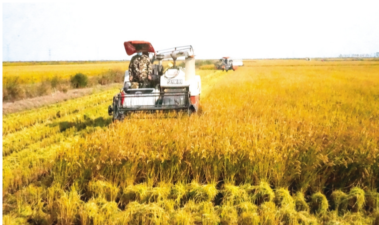
10月25日,青口投资公司两万亩水稻开镰收割,正式拉开秋收大幕。为确保秋收工作稳步运行,该公司细致制定收割方案,成立秋收工作小组,抢时间、抓进度、保质量,争取20天内完成收割任务。